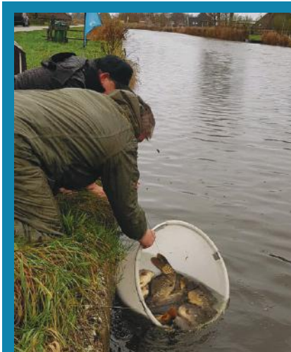
Uitzet van 'Midwest' nabij Kolhorn