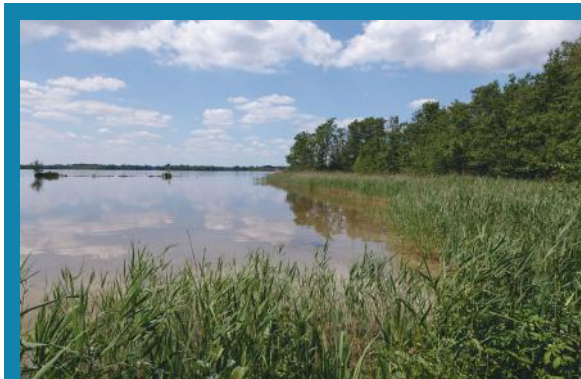
De Wijde Blik, een van de fraaiste plassen in het Vecht-plassengebied, en vroeger (tot 2000) een gerenommeerd karperwater. Immiddels karperarm en geen karperuitzet in het verschieft.

Hoe goed we het ook voor elkaar hebben er blijft zeker nog een en ander te wensen over. Dan heb ik het over grote wateren waar het 'vroeger' goed karperen was, maar waar je nu gemiddeld meer dan 24 uur moet wachten op een kans. In het midden van Nederland ligt een reeks van dat soort wateren. Bekend in deze regio zijn de Wijde Blik, de Vinkeveense plassen, de Nieuwkoopse plassen en de Spiegelplas. Grote heldere plassen die vaak mede door zandwinning zijn gevormd/uitgebreid en die nu veelal in beheer zijn bij Natuurmonumenten. Een gemene deler is dat in die wateren tussen de jaren 1960 en 1990 veel karper is uitgezet en daarna niet meer of hooguit incidenteel. Het gevolg is dat er weliswaar grote karpers zwemmen maar dat het bestand door natuurlijke sterfte jaarlijks verder uitdunt.