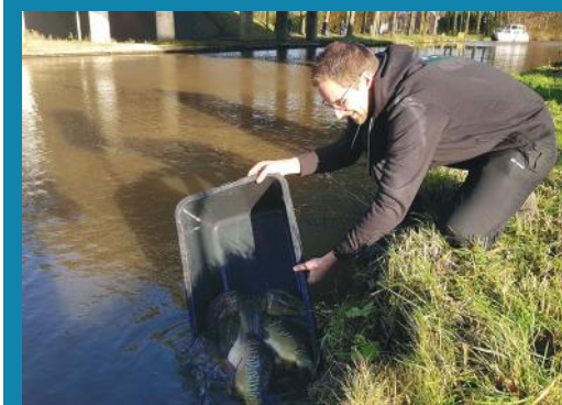
Teiltje EDKO's uitgezet bij Montfoort

Ook zo'n water dat een jaar of twintig geleden nog een goeie naam had en ik meen dat er ook al eens een spiegelkarperuitzetting is geweest, maar een uitzetprogramma was er nooit. Daar heeft de karpercommissie van MidWest Nederland verandering in gebracht. In het gekanaliseerde deel van de Hollandse IJssel nabij Montfoort werd in november 2021 een eerste SKP-uitzetting gedaan van 55 stuks. Of ze daar een beetje blijven hangen of verspreiden gaan we zien aan de hand van de matching van de Matching Community.