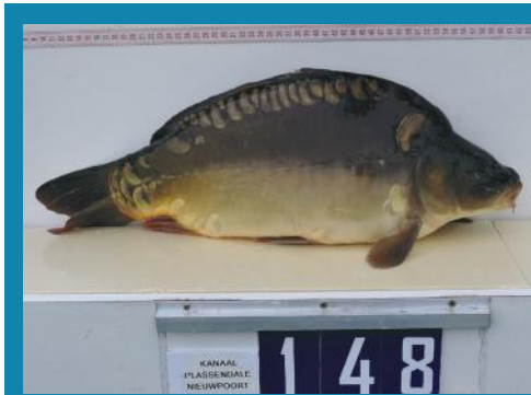
Met 4kg toch nét iets te zwaar (Bijmens)

In november leverde Bijmens traditioneel de spiegelkarpers voor de provincie West-Vlaanderen. De afgelopen paar jaren leken we op goede weg met deze kweker. Hun geleverde vissen voldeden hoofdzakelijk aan onze wensen: niet al te groot (1 à 1,8kg) en fraai beschubd. Dit jaar hebben we evenwel opnieuw een stapje achteruit gezet. De geleverde vissen waren wel erg aan de maat. Vissen tussen de drie en vier kilogram waren geen uitzondering. Op zich is dat best een 'veilig' gewicht, maar als je weet dat we in Vlaanderen eerdere kleinere hoeveelheden (totaalgewicht) uitzetten, dan ben je al snel klaar met die forse spiegels. De beschubbing was variabel, dus acceptabel. In december werd er in Oost-Vlaanderen uitgezet. Hier is Corten al flink wat jaren leverancier van dienst. Tot mijn ontgoocheling werd er helaas amper tot geen ruchtbaarheid aan deze uitzetting gegeven (zie verder in deze NB), en zag ik maar een paar plankfoto's de revue passeren. Wat ik zag, zag er goed uit!