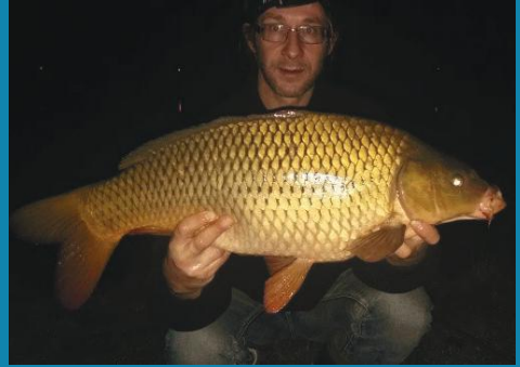
Twee edelschubs van Peschkes met zeer verschillende bouw

Afgelopen maand (december 2021) is voor het eerst ook in de Spiegelwaal bij Nijmegen die in open verbinding staat met de Waal uitgezet. Zowel het Maas-Waalkanaal als de Mookerplas staan nagenoeg het hele jaar in open verbinding met de Maas, alleen met extreem hoog water worden de sluisen gesloten.