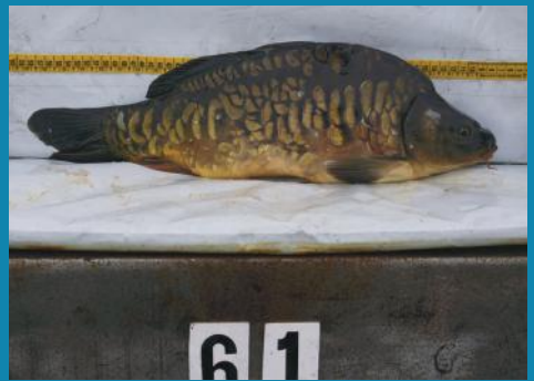
De vertrouwde Tsjechen voor Gent-Terneuzen