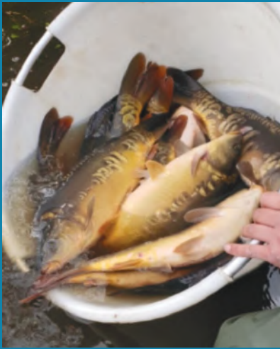
Teiltje Tsjechen voor SKP Rotterdam in 2019 uitgezet in de Schie en de Rotte