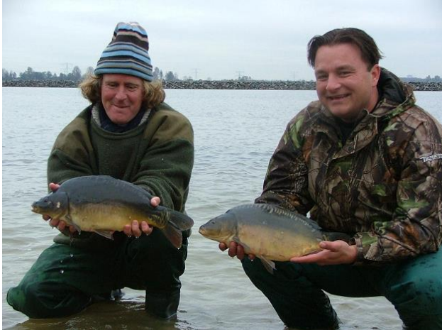
Eerste SKP-uitzetting in zuidelijke randmeren in 2005

rivieren en open meren en plassen, is de aanwas van karper sinds 2000 daar drastisch teruggelopen en dat schiep juist ruimte voor uitzettingen. Achteraf gezien was er geen beter moment om in te stappen met onze mega-SKP's. Denk bijvoorbeeld aan het IJssel-project (2000) het Friese boezem SKP (vanaf 2005), SKP randmeren (2005) en het SKP Benedenrivieren (2013). Het karpervissen op dat soort grote watercomplexen zal nooit heel gemakkelijk worden, maar door de uitzettingen met allerlei karpertypen/rassen en bloedlijnen is de beloning er tegenwoordig wel naar.