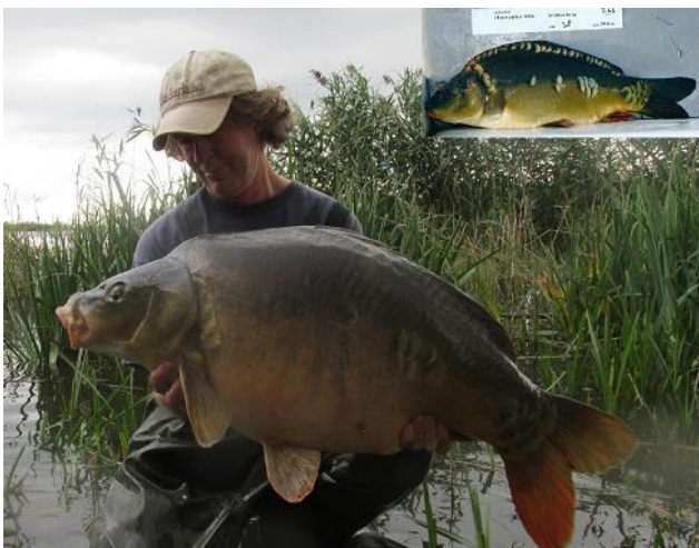
Persoonlijk weerzien twaalf jaar na uitzetting in zuidelijke randmeren

We kunnen het als verenigde karpervissers hebben over de spectaculaire stijging van het aantal meldingen van karpers van meer dan 20kg van dergelijke watercomplexen, maar evengoed kunnen we met gepaste trots wijzen op de variatie aan karpertypen/rassen/bloedlijnen die we (vooral sinds 2014) met de SKP's op open water aan het creëren zijn. De karperstand van open(baar) water is zo langzamerhand letterlijk en figuurlijk een afspiegeling aan het worden van wat we twintig jaar geleden voor ogen hadden: een gevarieerd en goed gedijend karperstand, met prachtige vissen, fraai beschubde spiegels van verschillende rassen en bloedlijnen, echte rijenkarpers, lederkarpers en robuust gebouwde edelschubs.