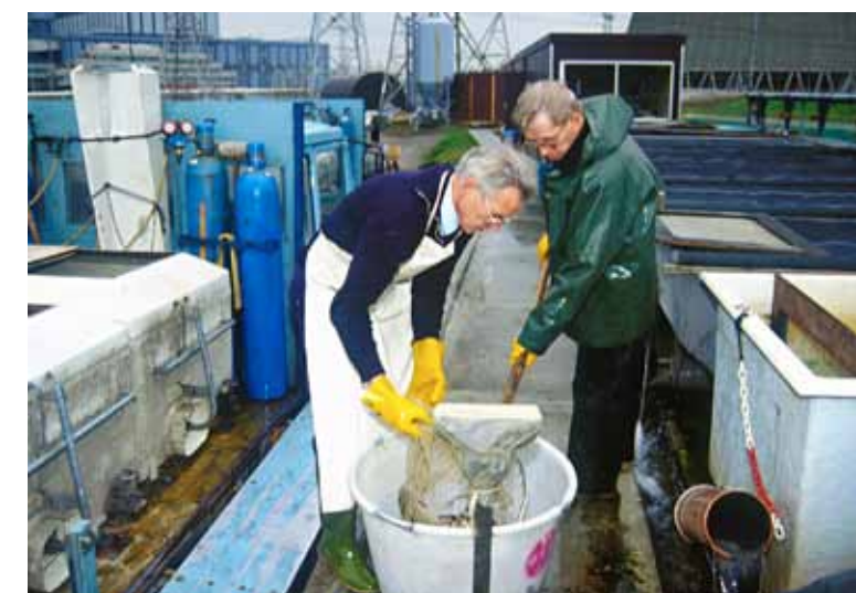
OVB chauffeurs wegen bij de Amercentrale de karpers, voordat ze worden overgeladen naar de vrachtwagen.

komen honderden aalscholvers vanaf het natuurgebied Oostvaardersplassen aangevlogen om in de kweekvijvers hun buik te vullen. Op alle mogelijke manieren probeert men de vogels te weren: knal- en lichteffecten, vogelverschrikkers, netten, geluidsgolven, helikopters, zelfs het inzetten van zeearenden! De aalscholvers wenen echter snel aan de maatregelen. Het overspannen van de vijvers met netten heeft nog het meeste effect, maar het overspannen van de grote vijvers – met een oppervlakte van 10 hectare – is technisch vrijwel onmogelijk en bovendien zeer kostbaar. De viskweek concentreert zich steeds meer in de kleinere vijvers, die met netten zijn overspannen. De aalscholvers leren echter om te landen op de paden tussen de vijvers en duiken dan onder de netten door het water in. Alleen in de kooien bij de Flevocentrale zijn de karpers nog veilig voor de aalscholvers, maar ook hier gaat de kweek steeds moeizamer. Omdat de centrale een zogeheten stop-startfunctie krijgt, is de continue afvoer van warm water niet meer gegarandeerd. De grote temperatuurschommelingen zijn funest voor de groeisnelheid van de karper. Daarom wijkt de OVB in 1987 uit naar de kolengestookte Amercentrale bij Geertuidenberg, die continu in bedrijf is. In het uitstroomkanaal van het koelwater worden 50 netten gehangen waarin de kweek van veel karper mogelijk is. Gedwongen door de aalscholverproblematiek neemt de OVB de