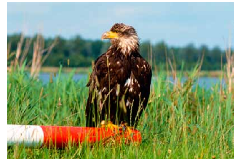
Zelfs de inzet van zeearenden was niet afdoende om de aalscholvers te weren van de kweekvijvers bij Lelystad.