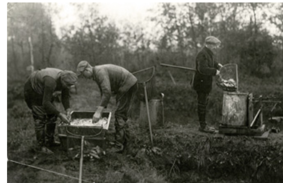
De afgeveste tweejarige karpers worden aan de vijver in Vaassen gesorteerd en gewogen op een bascule.

In de winter van 1902-1903 wordt het vijvercomplex bij Vaassen uitgebreid met nog eens 8 hectare water. De productie neemt verder toe en in 1904 kunnen ruim 130.000 eenjarige karpers worden geoogst; maar liefst 40.000 stuks meer dan in het voorgaande jaar. Net als in het buitenwater, heeft de Heidemaatschappij op de kweekvijvers te kampen met een forse uitval onder de jonge vis, tot wel 90%. Vooral de periode na het overzetten van het broed in de strekvijvers is kritiek. Zo maakt "een ontelbaar aantal" kikkers direct jacht op het visbroed. Dagelijks worden