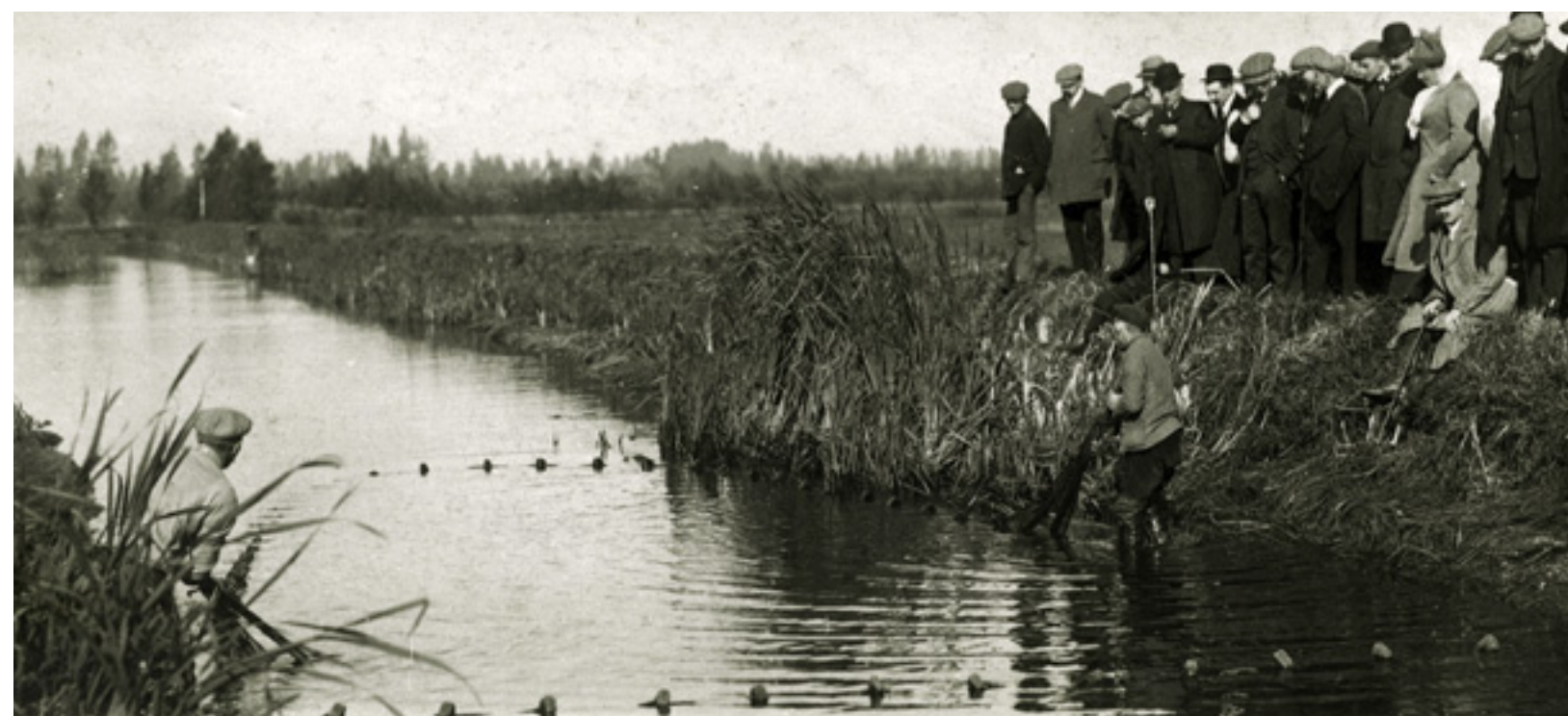
Kweekvijver in Vaassen met toeschouwers aan de waterkant, begin 1900.