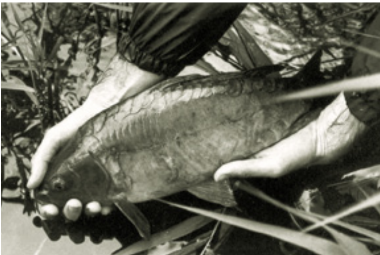
Karpers worden het belangrijkste kweekproduct.

er enkele nieuwe vijvers aangelegd. Door het pachten van twee bestaande vijvers bij Bergeijk beschikt de Heidemaatschappij in 1948 over vijf viskwekerijen. De Staat der Nederlanden gaat de exploitatiekosten dragen en de pootvis wordt voortaan door het zogenaamde Rijkspootvisfonds beschikbaar gesteld voor uitzettingsdoeleinden. Vanuit de hengelsportverenigingen is er een steeds verder toenemende vraag naar pootvis. Dit blijkt van beslissende betekenis te zijn voor de verdere ontwikkeling van de visteelt en de karperuitzettingen in Nederland. De viskwekerijen gaan op volle toeren draaien en karpers zijn het belangrijkste kweekproduct. In de volgende jaren zullen grote hoeveelheden karper in de Nederlandse wateren worden uitgezet.