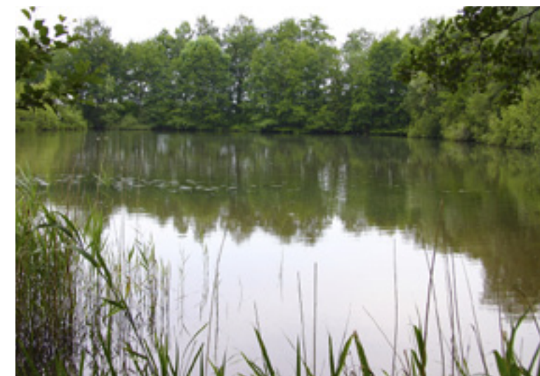
De Vaassense kweekvijvers liggen er vandaag de dag nog steeds schitterend bij.