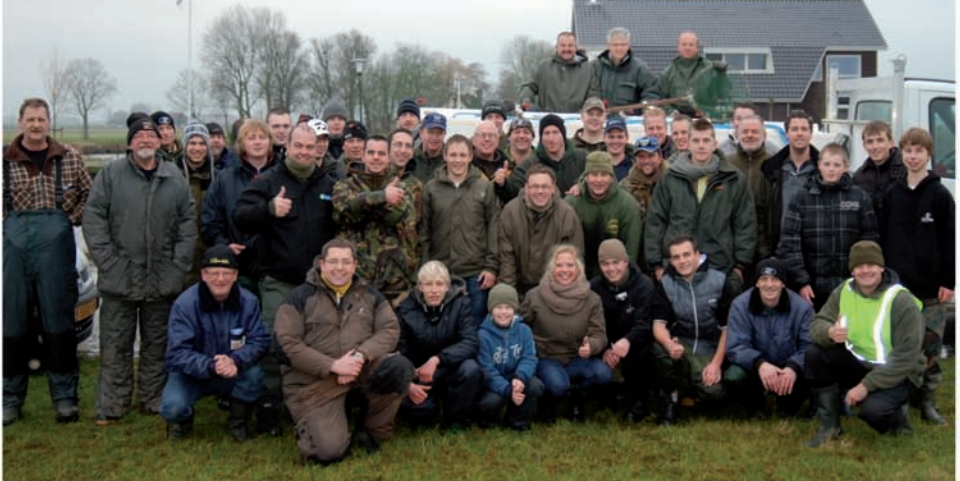
De klasbakken uit Friesland

De AHV ging in zee met Freedom lakes: een betaalwater in Frankrijk met een eigen kweker. De levearntie vond plaats op 10 november. Al met al een positieve ervaring, mooie vitale, onbeschadigde vissen en betrokken leveranciers. Ongeveer een derde van de partij van 1500 kilo bestond uit