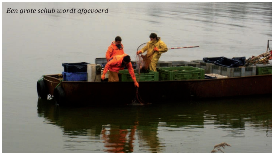
Een grote schub wordt afgevoerd

Afgelopen zomer zijn er met dezelfde insteek ook een aantal gesprekken geweest met lokale beroepsvissers. Zoals je wel vaker ziet, betekent het feit dat je om de tafel zit al pure winst. De bereidheid om tegemoet te komen aan elkaars wensen stond daarbij centraal. De eerste resultaten zijn nu al zichtbaar: er zijn beroepsvissers die spontaan hebben besloten zich aan te sluiten bij het terugzetten van karpers. In ruil voor niet meer dan goodwill van karpervissers en wellicht de toegezegde lijst van beroepsvissers die (spiegel)karpers ontzien. Intussen ligt er een conceptconvenant: benutting karper waar zowel het beroep als wij, verenigde karpervissers, ons fiat aan moeten geven. Loopt dat geen averij op dan hopen we dit voorjaar op een mooie locatie