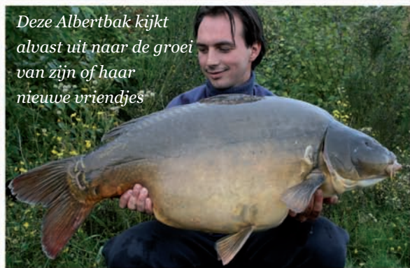
Deze Albertbak kijkt alvast uit naar de groei van zijn of haar nieuwe vriendjes

Geheel in overeenstemming met onze karper, kent ook de BVK geen landsgrenzen. Het actieterrain van de BVK situeert zich dus niet alleen in Nederland. Zie het als de ultieme kruisbestuiving van meerdere projecten en standpunten. Als Vlaming kunnen en mogen we niet blijven achterop hinken. Ook in Vlaanderen is er immers nog werk voor de boeg. Vlamingen met een kloppend hart voor doordacht karperbeheer, zullen ongetwijfeld een gevoel van 'thuiskomen' ervaren bij de BVK. Het moge duidelijk zijn dat ook de projecten in België ruim aan bod komen in deze en volgende BVK-nieuwsbrieven.